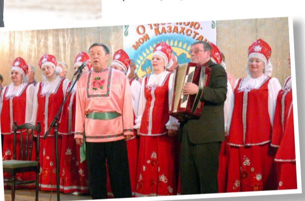
лаларыңыздай қараңыздаршы» деп айтатынмын.

ҚИНЭУ-да биыл үлкен жоба іске қосылды, идея өмір сүруде)